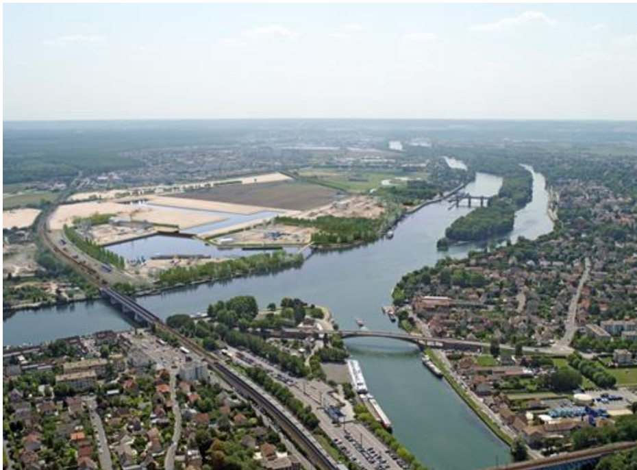
Port Seine Métropole Ouest à l'issue de la phase 1 des travaux (2024/2027) - Perspective

Les premiers travaux en Seine auront lieu sur la zone de bateaux-logements à partir du mois de février. Ils vont concerner l'installation de 16 ducs d'Albe. Il s'agit de pieux métalliques ancrés dans le fond du fleuve qui permettent d'amarrer les bateaux. De nouvelles passerelles d'accès aux péniches seront mises place. Génératrices de nuisances sonores, les opérations de battage des ducs d'Albe s'organiseront sur des plages horaires adaptées : entre 9h et 12h puis 13h et 16h. Au fur et à mesure de l'avancement des travaux, les occupants des bateaux-logements rejoindront progressivement leur place définitive.