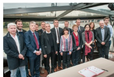
Signature officielle avec l'ensemble des partenaires.