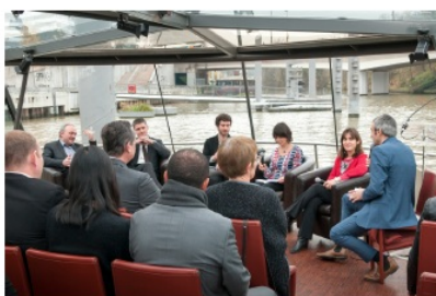
Table ronde sur les enjeux et bénéfices de la démarche CAP.